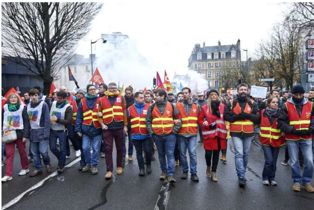
Manifestation contre la réforme des retraites, le 17 décembre, à Rennes.

Tribune. Le rapport Delevoye et les différentes déclarations du gouvernement dessinent un projet de réforme qui propose, dans les faits, le contraire de ce qu’il annonce et s’avère néfaste.